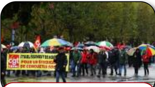
Au Havre, 3000 manifestants... lessivés? NON mais prêts à continuer le combat

Le mouvement social va entrer maintenant dans une nouvelle phase, les organisations sociales ne s'en cachent pas, même votée la loi reste impopulaire, 70 % de la population continue à soutenir les actions en cours. L'heure n'est donc ni au renoncement ni à l'abattement, la légitimité est bien du côté du mouvement social, le gouvernement n'en a donc pas fini avec cette régression sociale comme l'a si bien dit un ministre ! les organisations syndicales auront décidé de nouvelles actions à l'heure ou vous lirez ces lignes, notamment avec un nouveau rendez-vous lors de la dernière semaine de novembre. Comme l'a rappelé Bernard Thibaud dans une interview accordée à l'Humanité : «l'échéance principale est celle du 1er juillet 2011 à partir de laquelle les mesures que nous contes-