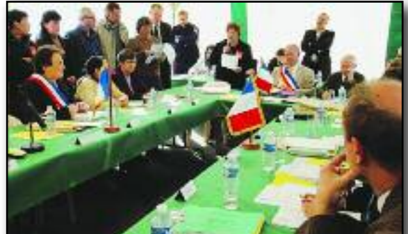
Devant le conseil municipal de Barentin, lors de précédentes mobilisations !

Fort du soutien de la population, gageons que ces salariés feront reculer ce patronat de choc !