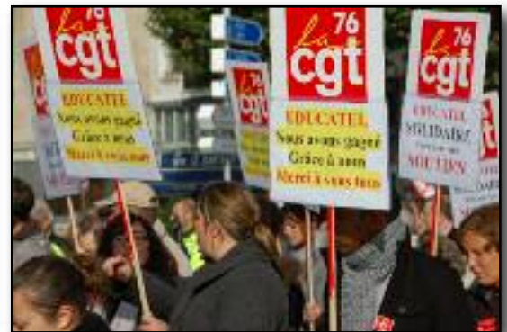
Les salariés d'Educatel lors de la manifestation du 23 octobre à Rouen

le patron, lui s'est vengé en prenant la décision de mettre 6 des 17 grévistes à pied en attendant leurs licenciements ! des menaces qui ne passent pas. Un conflit qui continue