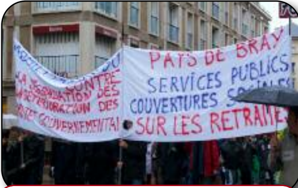
des manifestants venus du bout du département pour dire non a cette loi !

Rien n'y fait, ni les discours ayant maintes fois prophétisés l'essoufflement voire l'extinction de cet immense mouvement contre la réforme des retraites, ni les tentatives de reporter à 2012 le débat sur l'avenir de la protection sociale, ni les multiples contrefeux allumés par le gouvernement, les manœuvres d'arrière cour. Ce sont toujours des millions d'hommes et de femmes résolus à ne rien lâcher dont beaucoup ont défiés gaiement le gouvernement et .... les pluies de novembre.