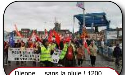
Dieppe, ...sans la pluie ! 1200 manifestants toujours aussi déterminés

Certes la loi est votée. Mais elle n'est pas promulguée. Et sa légitimité ne vaut guère plus que celle d'un gouvernement qui n'a qu'une idée : faire passer en force ce que le pays rejette. Le débat sur les retraites et sur une autre réforme possible n'est pas terminé. Il ne fait que commencer. C'est le message que les salariés, les retraités et les étudiants ont