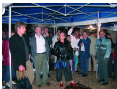
La soirée électorale organisée au siège de la fédération a connu un large succès et permit de suivre ensemble ( et de fêter ensemble) les résultats

Abonnement et diffusion de l'avenir de Seine-Maritime: Pour soutenir et faire connaître L'Avenir de Seine-Maritime souscrivez un abonnement (voir page 8) Faites connaître ce journal en nous communiquant les adresses de personnes désirant le recevoir contact : avenir de Seine-Maritime, 33 place de l'hôtel de ville, 76000 Rouen