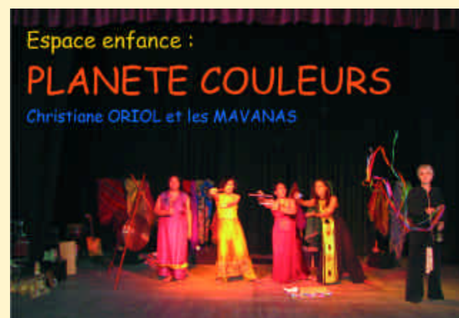
Espace enfance, dimanche après-midi